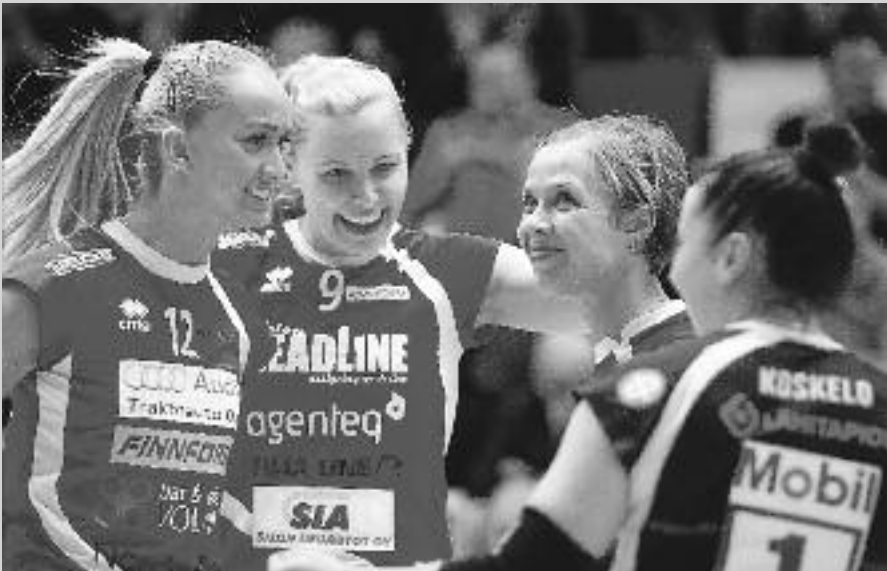
LP Viesti on kaikkien aikojen ensimmäinen suomalainen seura, joka pääsee mukaan lentopallon Mestarien liigaan.